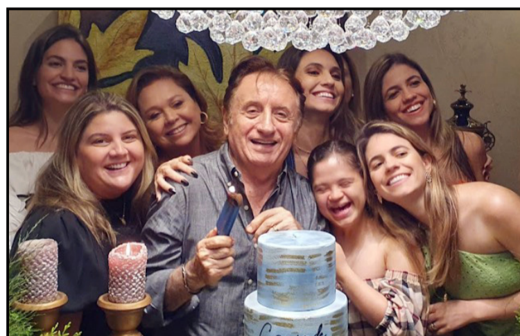
Na sessão parabéns, o anfitrião no melhor estilo descontração com as sobrinhas